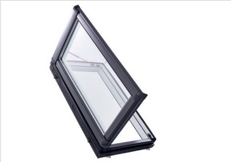
Bild zeigt Flügelanschlag rechts von innen gesehen.