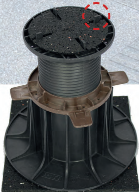
Abb.: Porto mit 3 mm Granulatplatte (im Lieferumfang enthalten)

Die rot markierten Porto-Träger unterstützen die Platten. Hier werden die nach oben weisenden Stege (siehe gestrichelte Markierung) abgeschnitten.