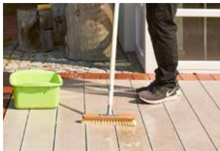
4. In Dielenrichtung schrubben