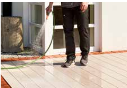
5. Sauber spülen