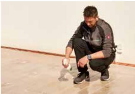
3. Flecken konzentriert einsprühen