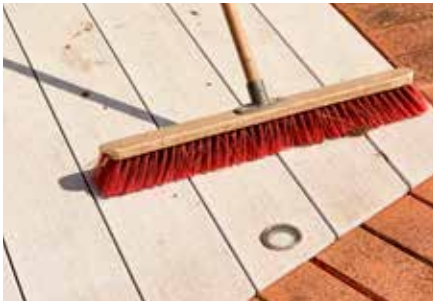
1. Schmutz abkehren