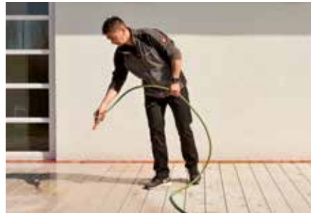
2. Fläche anfeuchten