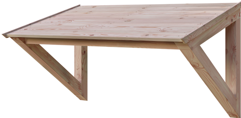
VORDACH POEL 148 x 87 cm

Massive Konstruktion aus hochwertiger Douglasie