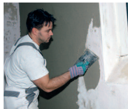
PCI Pericret lässt sich sehr geschmeidig verarbeiten - in Schichtdicken von 3 bis 50 mm.