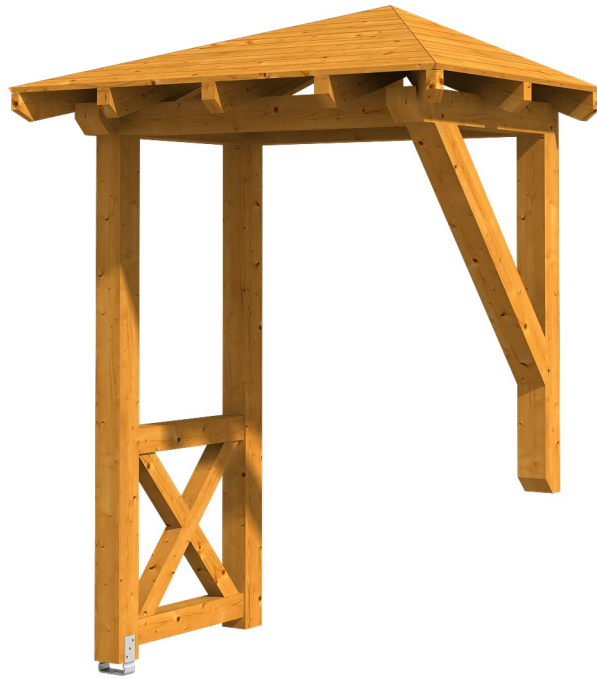
VORDACH WESEL 3 188 x 126 cm

Massive Konstruktion aus Konstruktionsvollholz (KVH-Fichte)