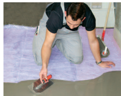
Die geeignete PCI Bodenausgleichsmasse wird auf der ausgelegten Glasfaserverstärkung PCI Armiermatte GFM ausgegossen und mit einer Spachtel verteilt (Mindestschichtdicke 5 mm).