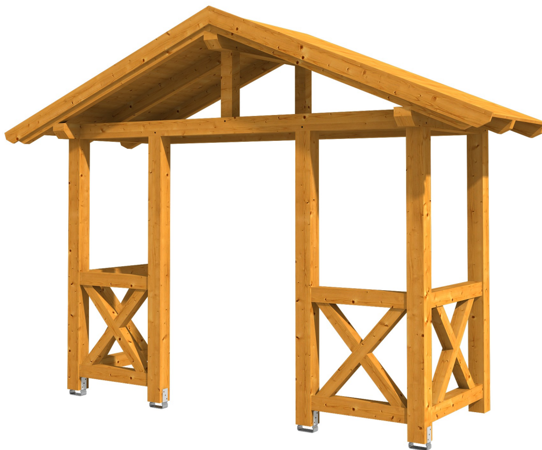
VORDACH STRALSUND 5 360 x 139 cm

Massive Konstruktion aus Konstruktionsvollholz (KVH-Fichte)