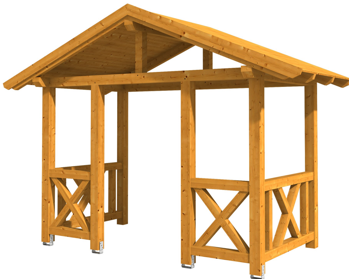
VORDACH STRALSUND 7 360 x 187 cm

Massive Konstruktion aus Konstruktionsvollholz (KVH-Fichte)