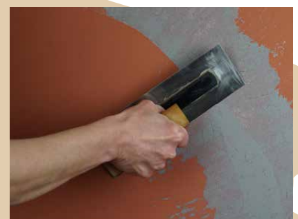
Auftrag der marmorierten Decklage