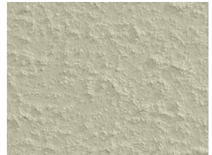
Struktur einer gut vorbereiteten Gipskartonplattenfläche

Vorsicht bei alten Gipskartonplatten! Die Kartonage kann vergilbende Stoffe enthalten, die durchschlagen.