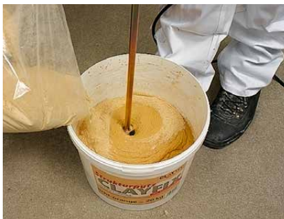
Einrühren des Eimerinhalts in Wasser. Danach 30 Minuten quellen lassen.

Zur Erzielung farbiger Akzente und Effekte können auch Pigmente in die feuchte Putzoberfläche eingearbeitet werden (Arbeitsprobe!).