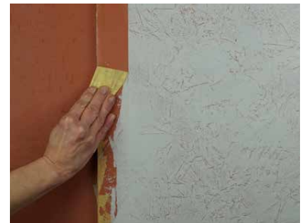
Abziehen scharfer Winkel

Auf Fleckspachtelungen kann eine tieffarbige, glänzende und gut geschützte Oberfläche mit Kanauerwachs-Emulsion erreicht werden. Dazu ist keine Vorbehandlung mit Tiefengrund notwendig. Die Emulsion wird sehr behutsam mit dem Schwamm aufgetragen, nicht eingerieben. Nach dem Trocknen können einzelne Stellen nachbehandelt werden. Zusätzliches Polieren erhöht den Glanzgrad.