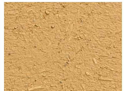
Struktur einer gut vorbereiteten Fläche aus Lehm-Unterputz