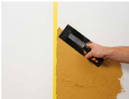
Auftrag der ersten Farbe an das Klebeband

Anders als andere Farbtöne kann YOSIMA WE 0 nach dem Trocknen nicht nur mit einem weichen Schwamm, sondern auch mit einem orangenen Schwamm-brett freigewischt werden. Bei diesem Arbeitsgang kann die Fläche sogar noch nachgerieben werden.