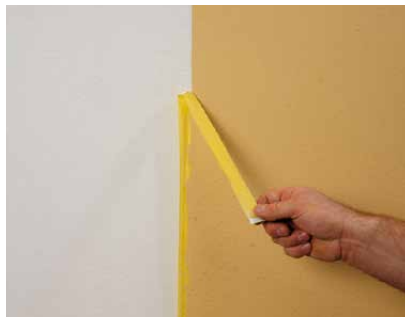
Abziehen nach dem Abwischen